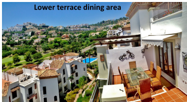
Lower terrace dining area