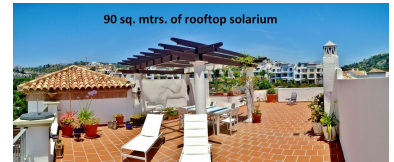
90 sq. mtrs. of rooftop solarium