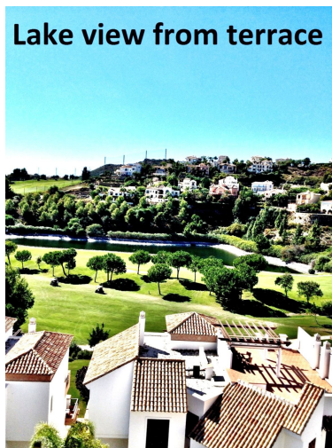
Lake view from terrace